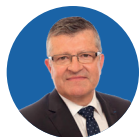
Franck PROUST Président de Nîmes Métropole