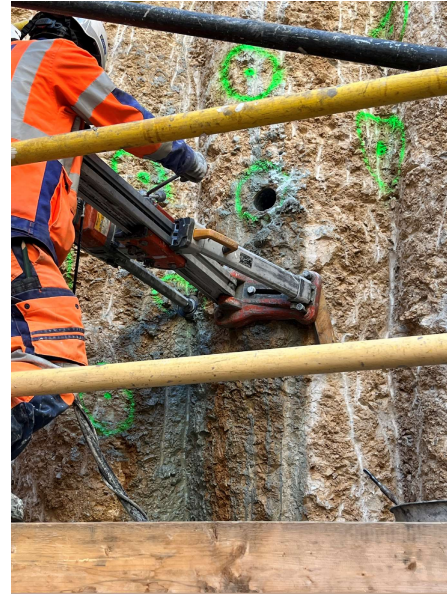
Photo du 15/11/2024 : Carottage pour préparation de la voûte parapluie (Renforcement de terrain pour la sortie du tunnelier)